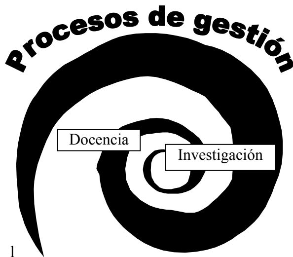
Figura 1. Esquema explicativo. Creación de los autores

los planteamientos que se vislumbra es la creación de equipos en los que ambos perfiles se combinen. La experiencia que retomaremos en esta presentación, retoma este planteamiento y nos ha permitido vincular la investigación con la docencia: la primera aporta todo su instrumental metodológico, su rigor académico en objetos de estudio que se encuentran en la segunda. El eje-guía de la experiencia es la docencia, entendida en sentido amplio, como la puesta en práctica de un currículo en el día a día de una institución, y la investigación nos permite describir y cuantificar la presencia de ciertas prácticas organizativas y pedagógicas en la Escuela y alimentar la toma de decisiones, mismas que influyen a su vez en la docencia. Se crea por consiguiente una espiral en la que la docencia alimenta a la investigación, misma que a su vez alimenta a la docencia y así sucesivamente con círculos cada vez más amplios. Esta espiral se da en un contexto institucional determinado, en el que existen procesos de gestión que propician este dinamismo.