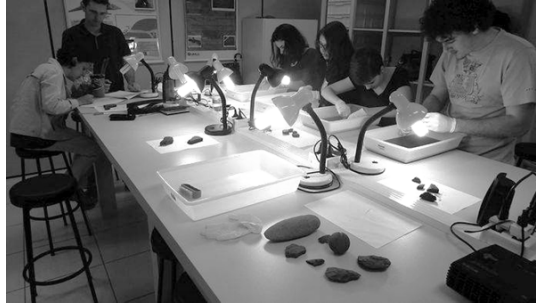
Figura 1. Estudiantes aprendiendo procedimientos de higienización, análisis y registro gráfico de artefactos.

territorio, temporalidad y, asimismo, actividades prácticas del llamado “manoseo”, como la higienización, representación gráfica y el brainstorming. Este último, abre un espacio para que estudiantes muestren sus habilidades de interpretación y compartan entre si diversas alternativas emanadas desde aquella “tormenta de ideas”, lo que permitirá validar la coherencia intrínseca de la propia materialidad, la calidad técnica y de composición del artefacto, así fuentes históricas eventualmente disponibles.