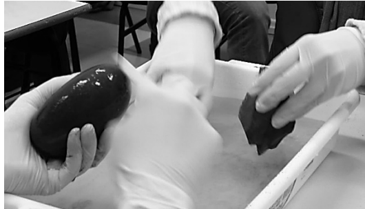
Figura 2. Higienización de material lítico durante actividades de Educación Patrimonial.

Otra estrategia metodológica educativa es el ejercicio de abstracción, exigido por aquella premisa de “colocarse en el lugar” de los sujetos que forjaron el objeto, llevada a cabo por estudiantes y participantes de cursos o talleres realizados en escuelas (con alumnos generalmente de 12 a 16 años de edad) o comunidades, constituyendo una serie de juegos de alteridad en los que necesidades, tácticas, tecnologías y relaciones con el medio deben ser re-elaboradas. Así en dicho “entre lugares” se crea un viaje desde el presente hacia el pasado, se construyen nociones de historicidad, uso y sentido del espacio geográfico, todo unido en un ámbito propiciado para la problematización sobre la permanencia, la legitimidad y la memoria de los grupos sociales contemporáneos.