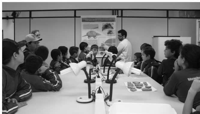
Figura 3. Becario demuestra a los estudiantes las diversas fases de la ocupación del territorio.

Otra estrategia metodológica educativa es el ejercicio de abstracción, exigido por aquella premisa de “colocarse en el lugar” de los sujetos que forjaron el objeto, llevada a cabo por estudiantes y participantes de cursos o talleres realizados en escuelas (con alumnos generalmente de 12 a 16 años de edad) o comunidades, constituyendo una serie de juegos de alteridad en los que necesidades, tácticas, tecnologías y relaciones con el medio deben ser re-elaboradas. Así en dicho “entre lugares” se crea un viaje desde el presente hacia el pasado, se construyen nociones de historicidad, uso y sentido del espacio geográfico, todo unido en un ámbito propiciado para la problematización sobre la permanencia, la legitimidad y la memoria de los grupos sociales contemporáneos.