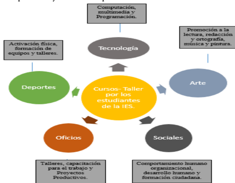
Figura 2. Cursos-taller en Centro Comunitario de Desarrollo Educativo, para la Población Vulnerable del Valle de Toluca a Través de los Estudiantes de la IES del Estado de México. Elaboración propia (López, 2014).

El abanico de posibles actividades en los cursos-taller como se muestra en la figura 2, es amplio y cada docente en conjunto con las Coordinaciones correspondientes a su área y con la Coordinación de Vinculación tendrán que seleccionar las que se considere más apropiadas para generar los procesos de aprendizaje, teniendo presentes su capacidad para apoyar y asesorar al estudiante en estos procesos y recursos disponibles.