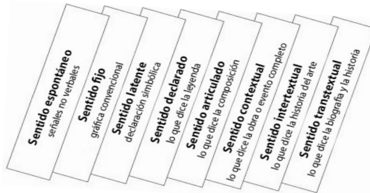
Figura 1. Modelo de ocho capas semánticas.

Por otra parte, Avgerinou y Pettersson (2011) analizaron treinta años de estudios de la alfabetización visual. Revisaron publicaciones entre 1969-1999 y construyeron un modelo teórico de cinco componentes principales como se muestra en la Figura 2: