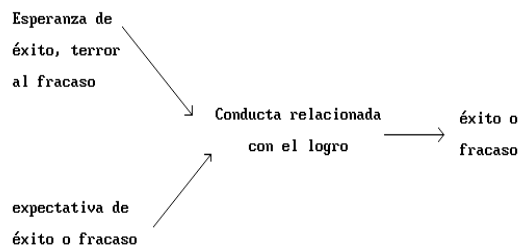
ETAPA 3. Tarea y reevaluación de adscripción